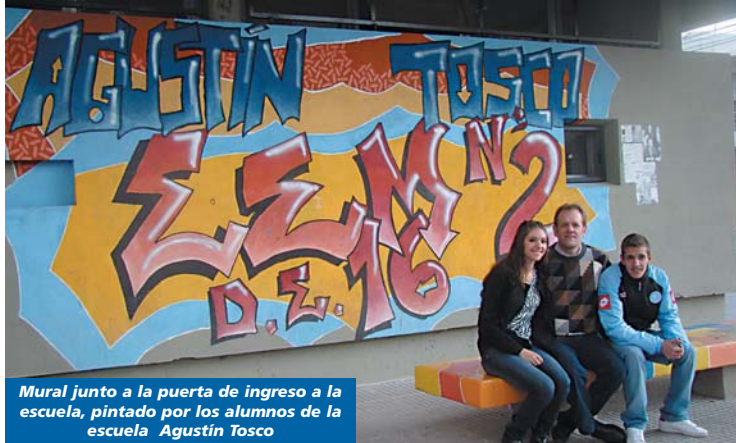
Mural junto a la puerta de ingreso a la escuela, pintado por los alumnos de la escuela Agustín Tosco