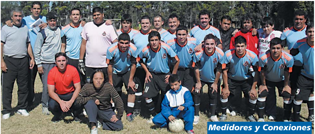
Medidores y Conexiones