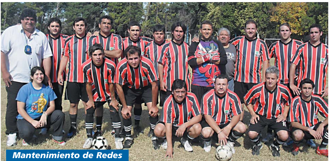
Mantenimiento de Redes