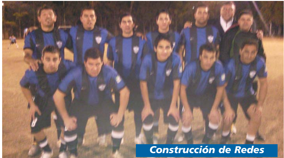
Construcción de Redes

Mañana se juega la Final del Torneo Preparación de la categoría Libres-Senior's y se definen el resto de los puestos