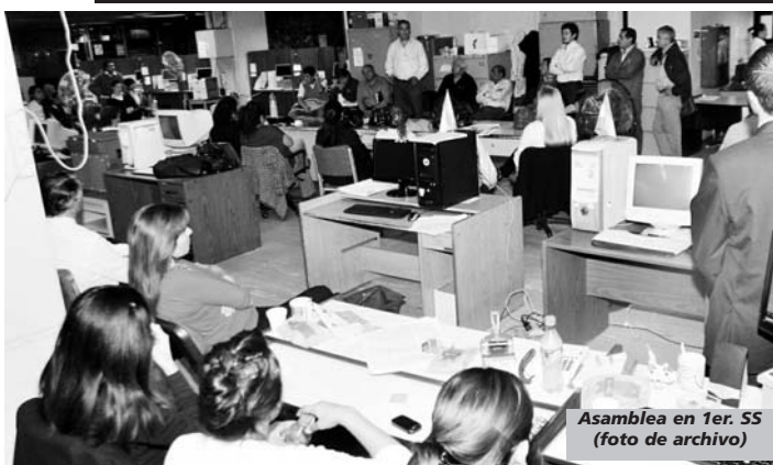
Asamblea en 1er. SS (foto de archivo)

A partir de distintas reuniones que se vienen desarrollando entre la Gerencia Comercial de la Empresa y los distintos sectores de Atención al Público, comprendidos en el Área Comercial, se expresan lineamientos de posibilidades y mejoras en cuanto al aspecto funcional del tema en cuestión, pues en cualquier Empresa el sector de atención al público, como pueden ser casos de recepción y comunicación directa con la gente, debe contar con el debido reconocimiento y ser contemplado en cuanto a sus necesidades y objetivos.