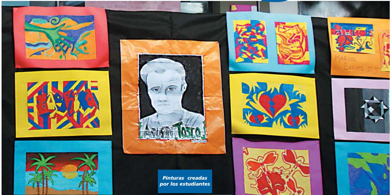
Pinturas creadas por los estudiantes