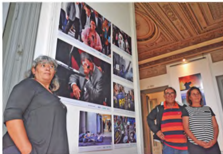
La creatividad de nuestros compañeros y compañeras expresada por la imagen de Agustín Tosco en una marcha

Hasta el 31 de enero permanecerá abierta la exposición de 89 fotografías tomadas entre 2017 y 2018 en las que como no podía ser de otra manera, están incluidas tomas de nuestros compañeros movilizad