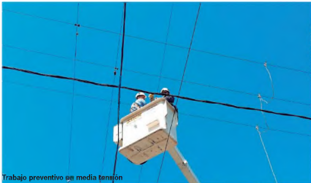
Trabajo preventivo en media tensión

de mantenimiento preventivo porque de continuar el falso contacto, se ocasiona el corte del conductor y por consiguiente la salida de servicio del distribuidor.