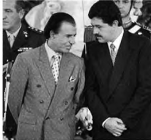
'Chiche' Aráoz, junto a Carlos Menem, en sus tiempos en que se desempeñaba como embajador ante la Organización de los Estados Americanos (OEA).

Miguel Ángel “Coqui” Arias fue secuestrado a los 19 años