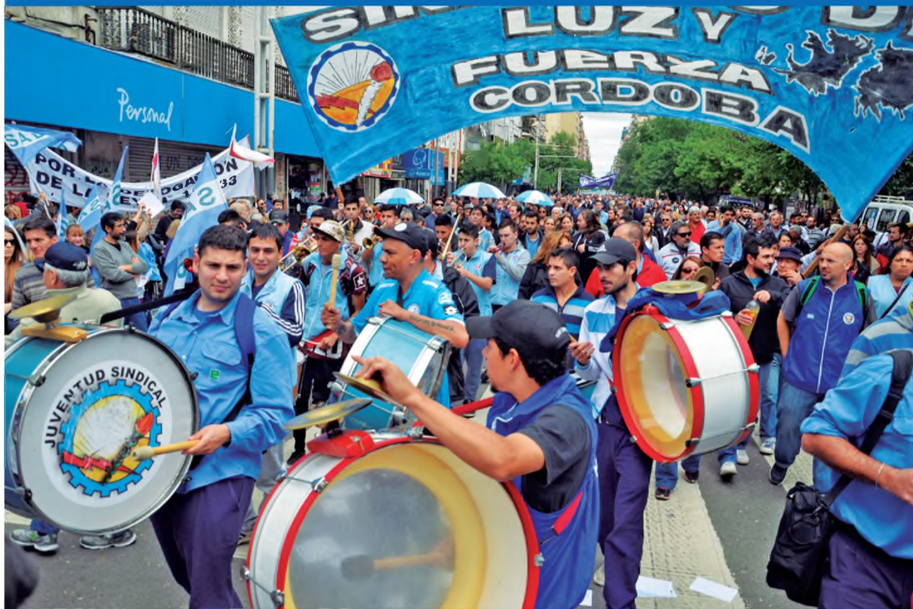
Movilización lucifuercista (foto de archivo)

Mensajes de nuestro Secretario General (ver páginas 5, 6 y 7)