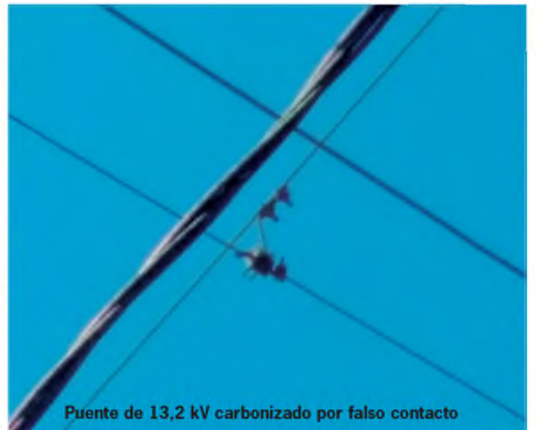
Puente de 13,2 kV carbonizado por falso contacto