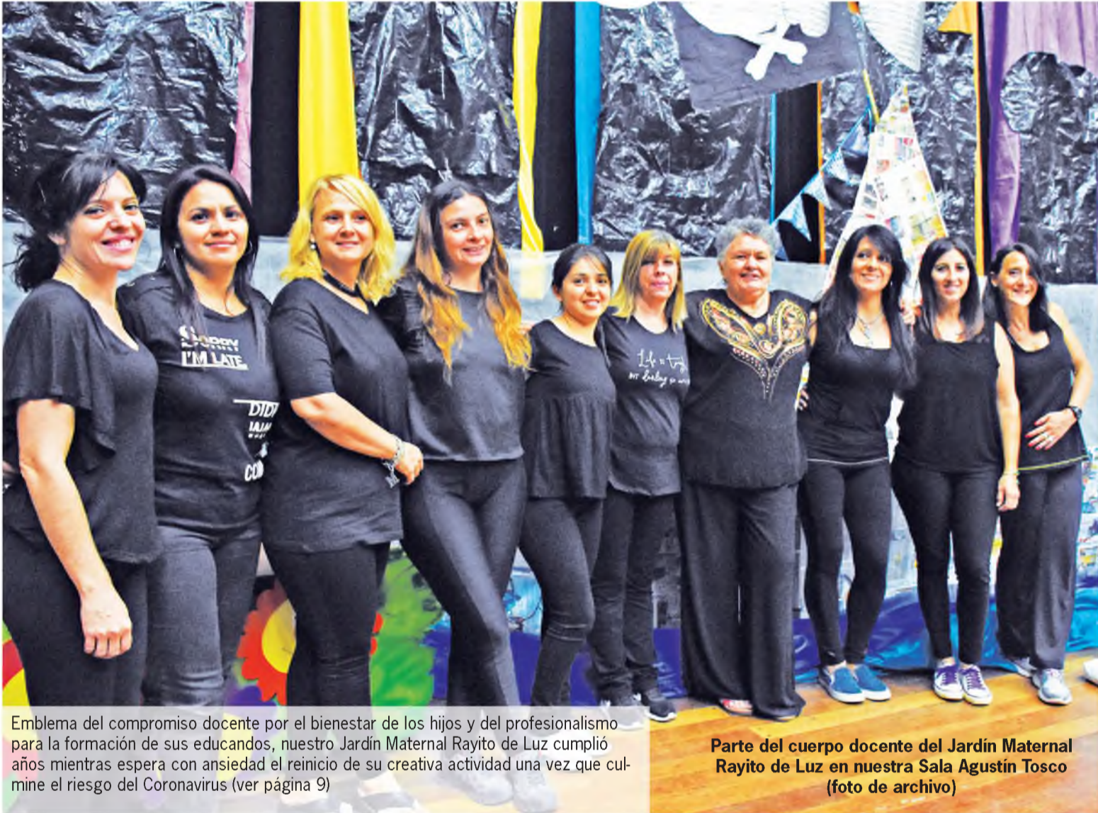
Emblema del compromiso docente por el bienestar de los hijos y del profesionalismo para la formación de sus educandos, nuestro Jardín Maternal Rayito de Luz cumplió años mientras espera con ansiedad el reinicio de su creativa actividad una vez que culmine el riesgo del Coronavirus (ver página 9)