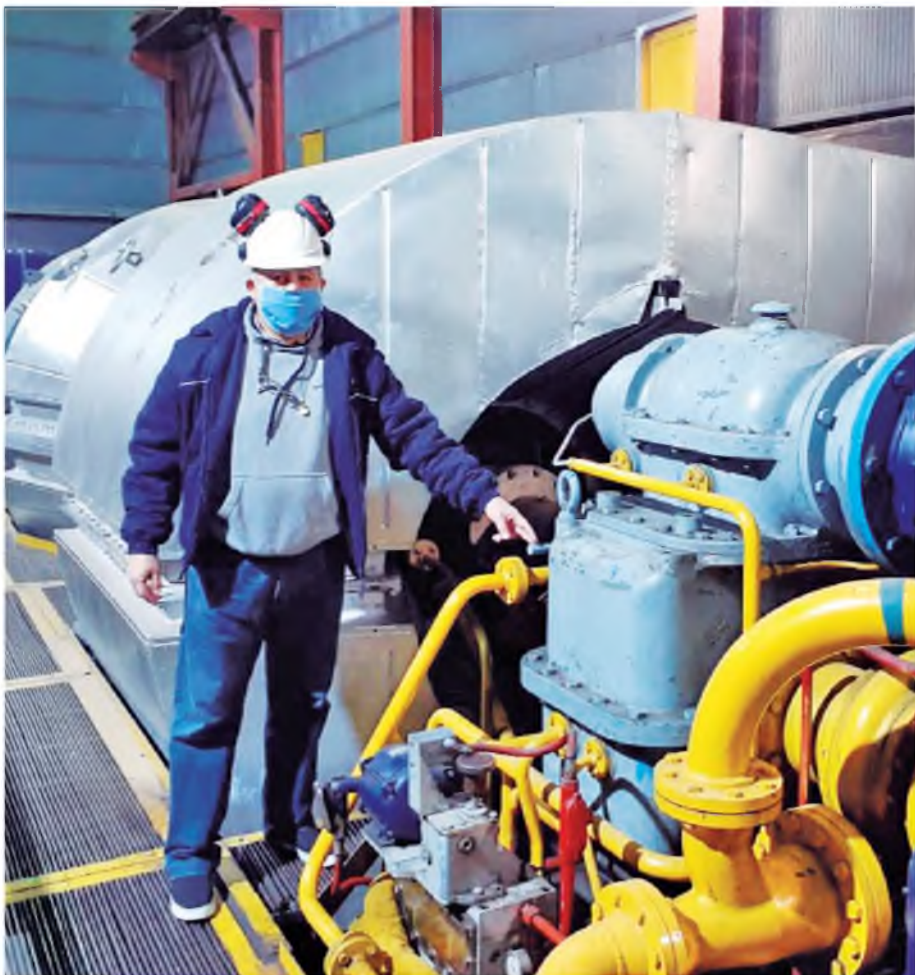
Una de las máquinas generadoras TG de la Central Deán Funes