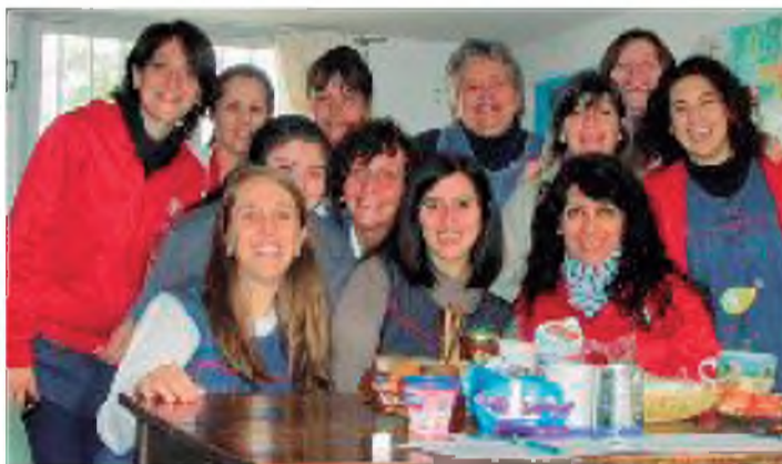
El primer plantel docente aprobado en 2010. Luego se sumarán otras compañeras al staff

Las Guardianas del jardín, SUS MAESTRAS, están LISTAS y PREPARADAS, con el mismo impulso que tuvieron las Madres que le dieron origen, para acondicionarlo y así volver