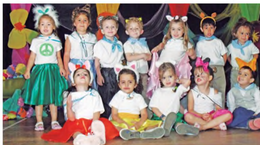
Promoción 2012 ya en la sede del Complejo Deán Funes