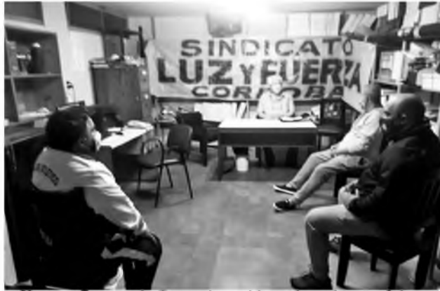
Nuestro Secretario General reunido en la sede gremial con compañeros de la Central Deán Funes

También nos preocupa sobremanera que no habrá tiempo suficiente para poner las máquinas en condiciones si no están formados adecuadamente los equipos de trabajo. En ese sentido los compañeros de Generación están desprotegidos por el modo intransigente de proceder de la gerencia que insiste en que se arreglen con un solo operador. Ahora bien, si se avería una máquina seguramente van a responsabilizar a los trabajadores, pese a que no había dos operadores como debe ser, y entonces la Empresa tendrá que convocar a trabajadores de otros sectores para reparar rápidamente la máquina en lugar de prevenir esta situación, favoreciendo por