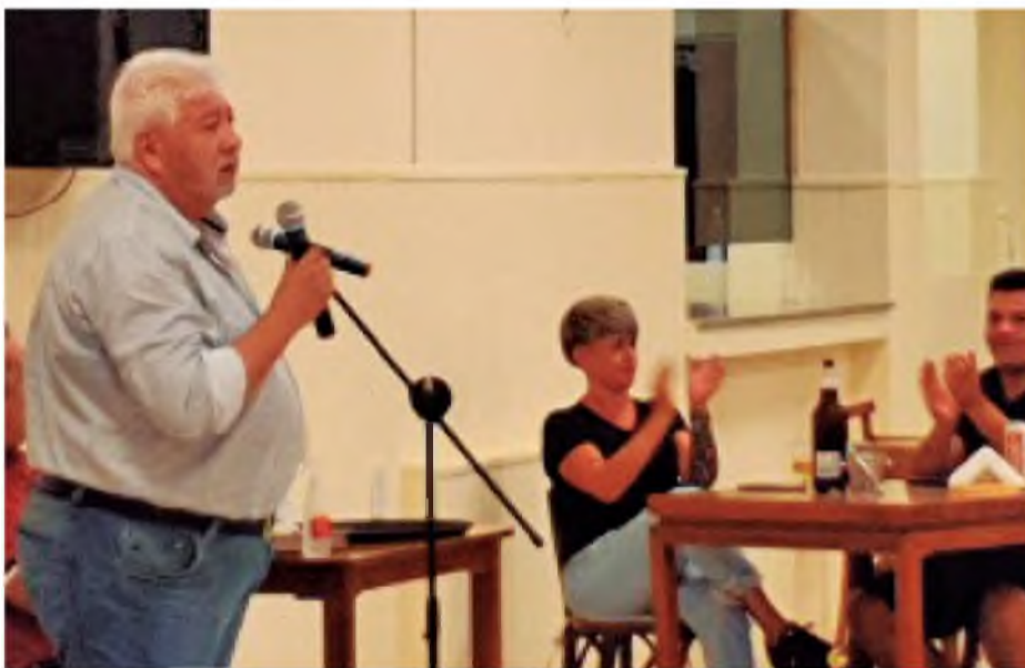
Nuestro Secretario General en la Colonia de Mina Clavero

“Que sirva este momento de recreación para volver a casa convencidos que tenemos que seguir peleando”