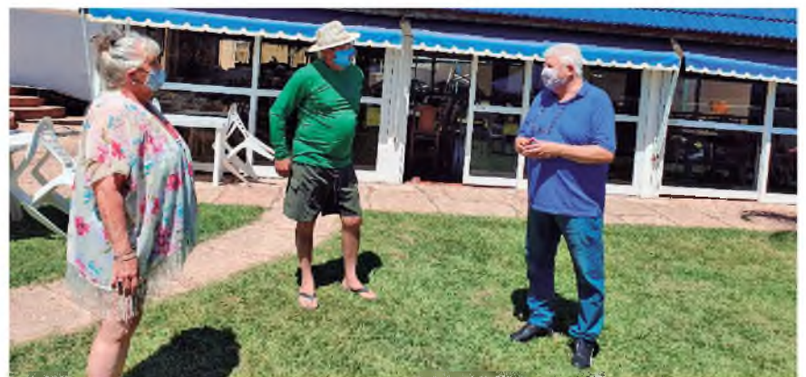
Nuestro Secretario General conversando con afiliados