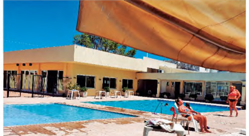
Pileta de la Colonia Gral. San Martín