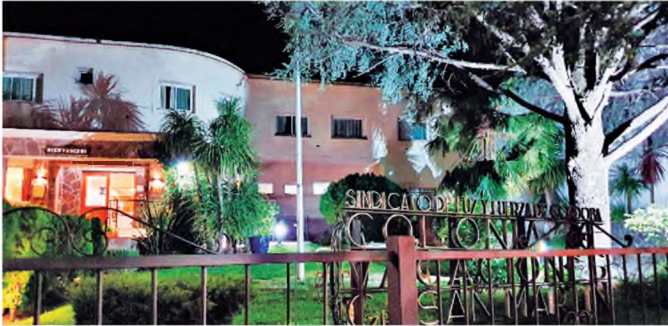
Colonia General San Martín