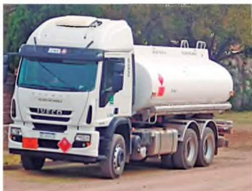
El camión cisterna de EPEC

Los trabajadores lucifuercistas estamos al lado de los cordobeses, cada vez que nos necesitan, las 24 horas, los 365 días del año, haciendo frente a numerosas carencias y a las adversidades del clima o del terreno.