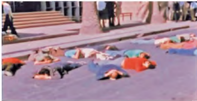
Empleados de Luz y Fuerza Córdoba obligados a permanecer "cuerpo a tierra" en el pavimento frente a nuestra sede gremial el día que asaltaron e intervinieron nuestro Sindicato. Después se los llevaron detenidos.

Durante los operativos de los días 9 al 11 de octubre de 1974, también fueron allanados los locales