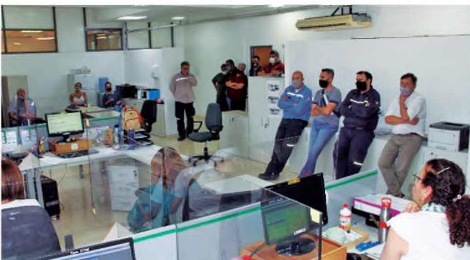
Importante presencia de compañeros y compañeras en Río Ceballos