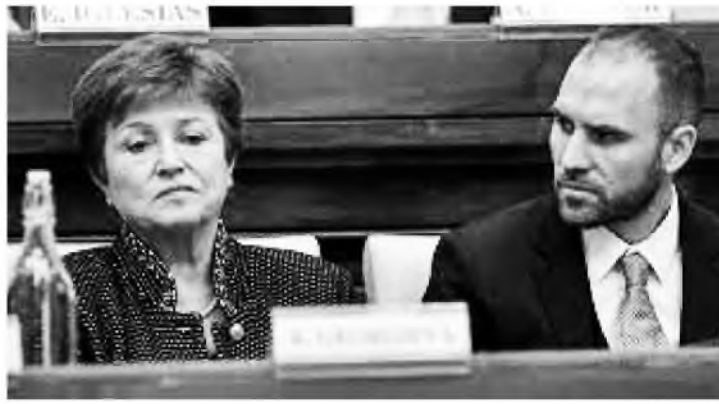
Kristalina Georgieva, titular del FMI y Martín Guzmán, Ministro de Economía y negociador de la Deuda Argentina

Se ha ido afianzando erróneamente la idea, en propios y extraños, de que el peronismo es igual sólo a "justicia social", y que la justicia social implica más o menos lo mismo que igualdad social. Para el peronismo, y para el imaginario popular argentino, la justicia social es una marca registrada, a la cual se arriba a partir de poner al trabajo como ordenador social, es el trabajo que dignifica y posibilita el acceso todo lo demás: educación, salud, vivienda, cultura, previsión social, participación política plena. En ningún lugar del mundo un plan de achicamiento del gasto centrado en la "pulcritud fiscal" dinamiza la rueda eco-